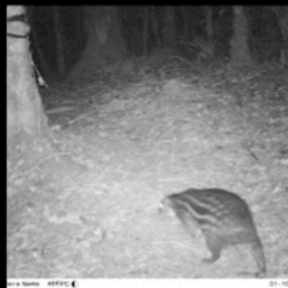
Camera Name 48F9C ◀ 01-10