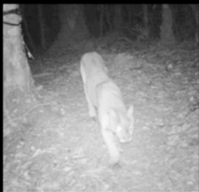
Camera Name 48F9C ◀ 01-08