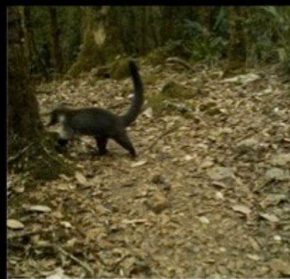
Camera Name 57F13C ◀ 02-10