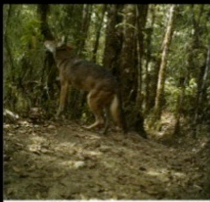
Camera Name 57F13C ● 02-02-20