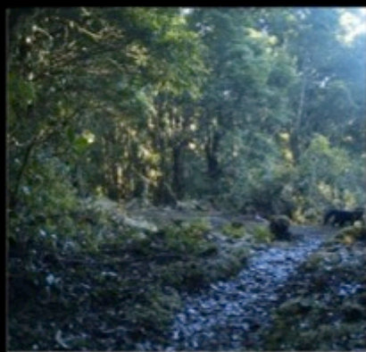
Camera Name 44F9C ● 02-21