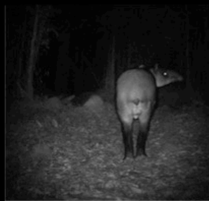
Camera Name 57F13C ● 02-01-20