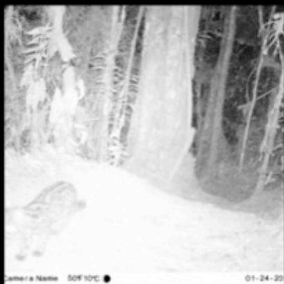
Camera Name 50F10C ● 01-24-20