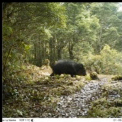
Camera Name 50F11C ◀ 01-09