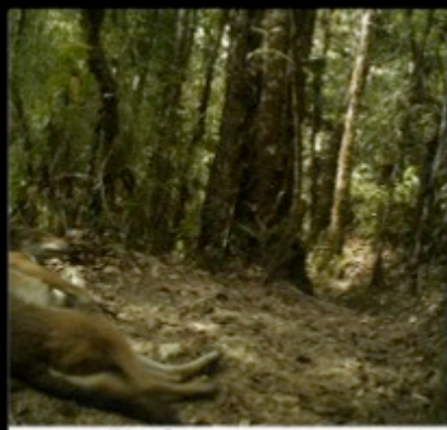
Camera Name 57F13C ● 02-02-20